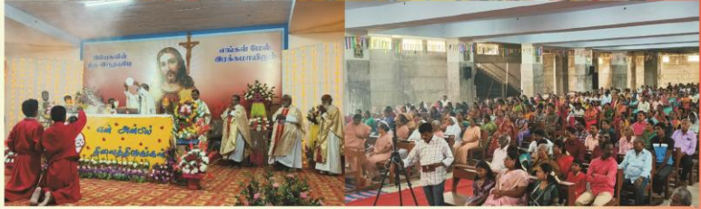
Sacred Heart of Jesus Feast Mass at Dharmapuri Cathedral