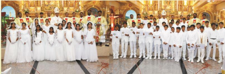
Feast Mass and Confirmation at Krishnagiri