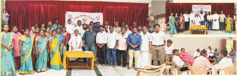
SC/ST Commission General Body Meeting at Bishop's House