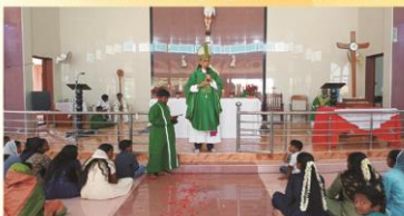
Dalit Sunday Mass at Soolagiri