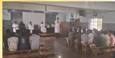
Vocation Camp at Christupalayam