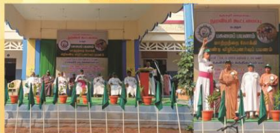
CRI Programme at Elathagiri