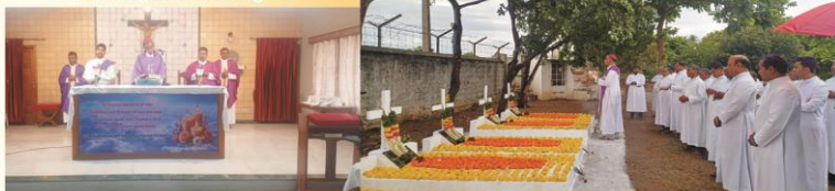
Clergy recollection and Requiem Mass at Bishop's House