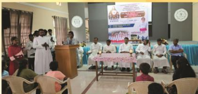
Catechism children programme at Dharmapuri

Vicar General, Priests, Sisters and Laity Dharmapuri Diocese